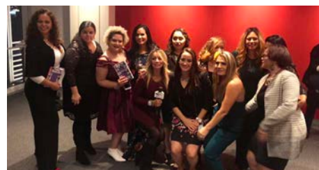
En la capital del mundo se llevó a cabo el lanzamiento en el New York Times.

Frente a la Torre Eiffel tuvieron la oportunidad de hacer una sesión de fotos con profesionales contratados especialmente para la ocasión. Durante su recorrido las autoras firmaron autógrafos en diferentes eventos, además tuvieron la oportunidad de posar junto a sus lectores.