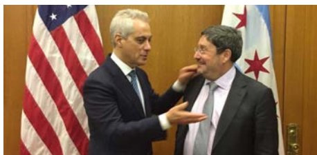
El alcalde de Chicago Rahm Emanuel y el embajador de Colombia en Washington Francisco Santos intercambiaron ideas, entre ellas, concernientes a Bogotá y Chicago.

Respecto al proceso de paz manifestó que “está en un momento muy difícil, por varias razones: primero, porque dejaron (el gobierno anterior) una maraña institucional brutal que estamos desenredando, crearon tantas instituciones para hacer lo mismo, con tanta gente, sin financiación.” Por ejemplo, “nadie está cuidando a los desmovilizados, no saben dónde están, el 70% de los desmovilizados que se fueron para sus casas los estamos buscando. El segundo desorden... es que además no dejaron la plata para financiar los programas, estamos consiguiéndola. Estamos ordenando lo que dejaron pero, el otro problema más grave, y por eso está en crisis, es porque siguieron delinquiendo”, refiriéndose al caso de Jesús Santrich, líder del extinto grupo terrorista de las FARC, “tratando de meter 10 toneladas de coca a los Estados Unidos. Les dan semejante oportunidad, la oportunidad más grande que se le puede dar a un ser humano es decirle aquí tiene una segunda oportunidad sobre la tierra... y encuentran al señor Santrich”, haciendo referencia al video que lo evidencia en una negociación de drogas ilícitas, por el cual fue capturado y podría ser